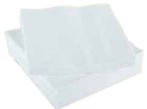
Des serviettes blanches ou de l'essuie-tout