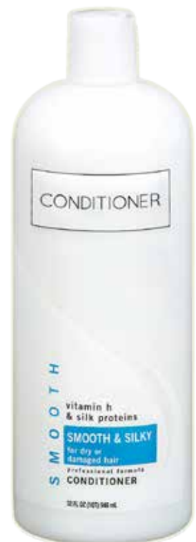
Bain de crème, après-shampooing ou baume