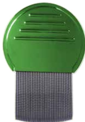
Un peigne à poux

Vous trouverez un peigne à poux à la pharmacie. Il est muni de dents rigides, très fines et en pointe qui sont très rapprochées les unes des autres.