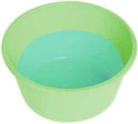
Bir tas ılık su