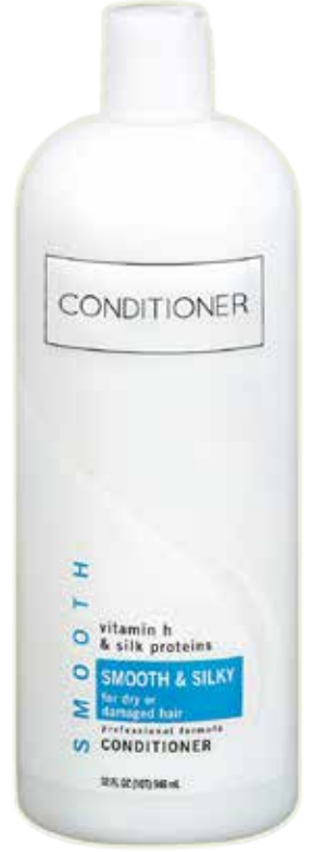
Saç kremi, şampuan, balsam

Eczaneden temin edeceğimiz sık, ince uçlu ve bükülmeyen dişlere sahip bit tarağı.